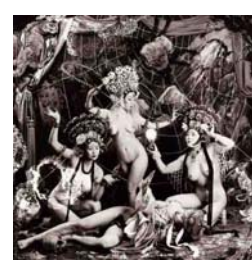
THE WEB CAVE (1997) 37 x 37 cm.