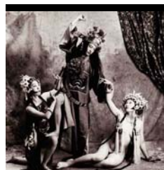
BEATING THE PRINCESS (1997) 37 x 37 cm.