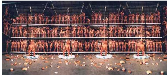
MY AMERICA (1999) 101,20 x 240,35 cm.

Esta performance reunió a cincuenta y seis ciudadanos americanos desnudos, de varias edades y procedencias, para configurar una especie de cuadro viviente frontal, con un andamio de tres plantas en forma de "u", donde aquellos se agrupan en torno a la figura del sujeto único que se incorpora a la acción en tanto que objeto de las multitudes. Zhang Huan es este sujeto que se ofrece como víctima propiciatoria, tomando asiento en una pequeña piscina de plástico, donde recibe estoicamente la hostilidad de estos ciudadanos que representan a las masas urbanas de cualquier ciudad occidental.