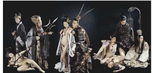
DIAO CHAN (2003) 50 x 100 cm.