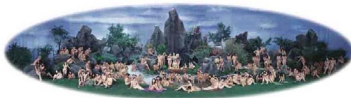
YAOCHI (2005) 127 x 410 cm.

El artista describe el despliegue que exigen sus convocatorias, para organizar la composición de un determinado modelo, en los mismos términos que serían necesarios para disponer la escenografía de una ópera. Primero, hace el borrador de la escena que pretende representar, y, a continuación, imagina las localizaciones que trata de reproducir y hace adquisición de todos los accesorios que necesita para montar sus escenas teatrales. De ordinario, utiliza el Beijing Movie Studio para montar sus escenarios, durante una o dos semanas, con un grupo de entre diez y veinte personas. El último paso consiste en reunir un día los modelos escogidos, cámaras, fotógrafos, asistentes, para hacer la fotografía. Con tres o cuatro negativos, el artista empieza a trabajar, escaneándolos para manipular digitalmente la fotografía hasta obtener el resultado final que no se produce sino al cabo de unos dos meses.