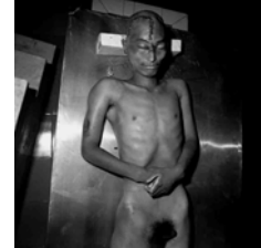
A YOUNG MAN KILLED IN A TRAFFIC ACCIDENT (1998) 46 x 46 cm.