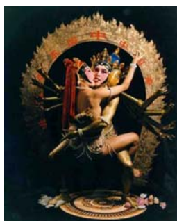
HAPPY BUDDHA (1998) 125 x 98 cm.