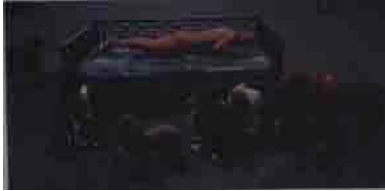
PILGRIMAGE (1998) 101, 20 x 202,40 cm.

En "Pilgrimage" (1998), la primera obra que Zhang Huan hizo al llegar a Nueva York, el artista se concibe a sí mismo como sujeto de una peregrinación al lugar de destino escogido, como una forma de autoexilio