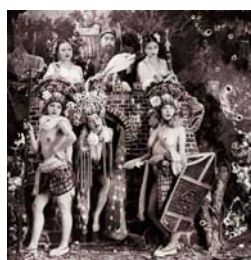
THE EMPTY CITY (1998) 37 x 37 cm.