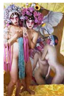
QUARTER (1998) 127 x 89 cm.