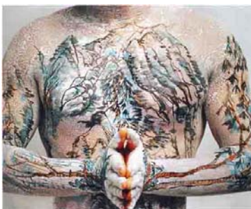
CHINESE SHAN SHUI TATOO (1999) 50 x 60 cm.

Yan Huang proyecta la representación del paisaje sobre el cuerpo humano, recurriendo al dibujo y a la pintura tradicionales, en busca de una especie de toponimia de paisajes urbanos o forestales, que se relaciona de nuevo con la identidad. Es la metáfora perfecta del paisaje portátil: de hecho, todos los paisajes se mueven con el sujeto que los transporta, al igual que se transporta la identidad a la que se pertenece