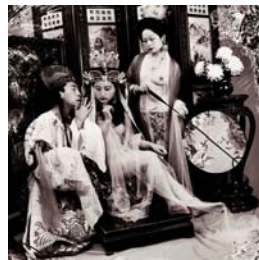
SELF PORTRAIT (1998) 37 x 37 cm.