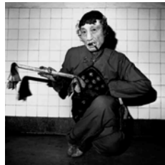
AN OLD PEKING OPERA ACTOR PLAYING A FEMALE ROLE (1995) 46 x 46 cm.