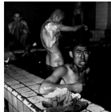
TWO MINERS IN A PUBLIC BATH HOUSE (1998) 46 x 46 cm.