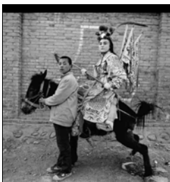
DUELING THE WHITE- BONED DEMON (1998) 37x 37 cm.