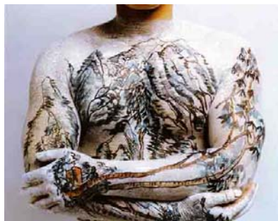
CHINESE SHAN SHUI TATOO (1999) 50 x 60 cm.