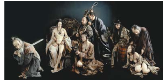
XI SHI (2003) 50 x 100 cm.