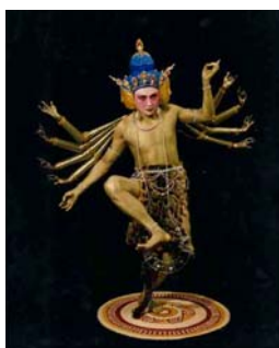
I'M BUDDHA (1998) 127 x 100 cm.

La secularización de Buda y el budismo es uno de los objetivos del artista que, sin menoscabo del significado y las implicaciones que la doctrina ha tenido en China y su influencia sobre el desarrollo de la cultura china, trata de mostrar una versión diferente oponiendo a la imagen mística y apolínea de esta divinidad, la imagen dionisiaca, ebria y sensual, que se entrega a los placeres terrenales.