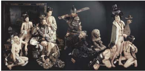
WANG ZHAOJUN (2003) 50 x 100 cm.

Sobre un fondo oscuro, las figuras destacan fomentado el claroscuro, que los cuerpos femeninos desnudos o semidesnudos intensifican. Cada uno de los "cuadros" fijados en las imágenes fotográficas correspondientes sugiere un relato: los conjuntos de figuras que aparecen retratados forman pequeñas sociedades secretas donde la intriga es el vehículo de comunicación por excelencia. Los personajes se hablan al oído, se agrupan entre ellos, se miran, se rozan, se tocan, gesticulan expresivamente.