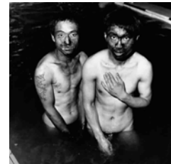
TWO MINERS (1996) 46 x 46 cm.