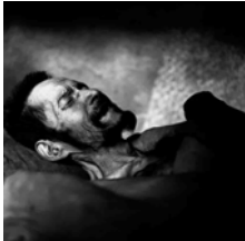
A DYING FARMER (1996) 46 x 46 cm.

La serie "Los Chinos" de Liu Zheng podría abrir esta exposición por cuanto los retratos que la componen se convierten en datos útiles para reconstruir la memoria histórica a partir del lado oscuro de los modelos retratados en blanco y negro, que contrastan con la espectacular transformación de China y de sus escenarios domésticos, donde transcurre la vida cotidiana de sus ocupantes