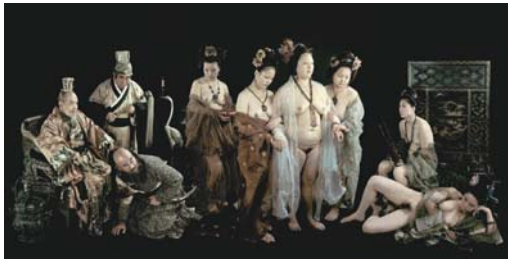
YANG GUIFEI (2003) 50 x 100 cm.