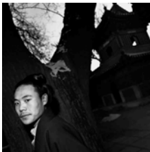
A YOUNG THAOIST PRIEST (1995) 46 x 46 cm.