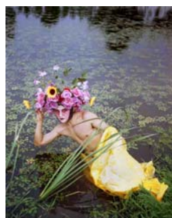
RAINING BUDDHA (1998) 127 x 100 cm.