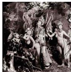
MUKE VILLAGE (1998) 37 x 37 cm.