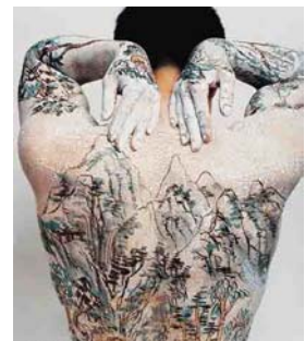
CHINESE SHAN SHUI TATOO (1999) 50 x 60 cm.