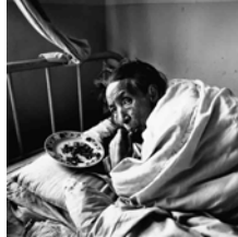
A DYING OLD WOMAN (1995) 46 x 46 cm.